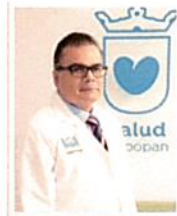
Médico con especialidad en Ortopedia y Traumatología

Correo electrónico transparencia.salud@zapopan.gob.mx Página web: www.ssmz.gob.mx