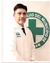
Médico con especialidad en Urgencias