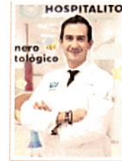
Médico con especialidad en Ortopedia y Traumatología