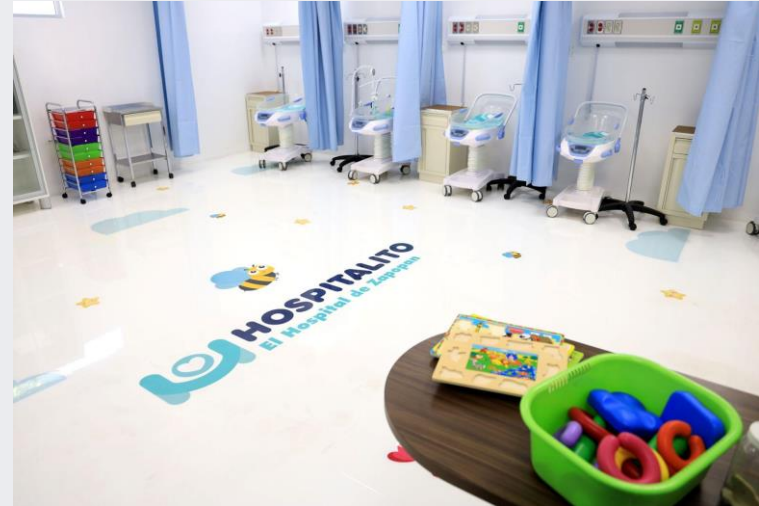
29 de abril Reapertura de Tococirugía, Hospitalización Pediatría y Cunero Patológico