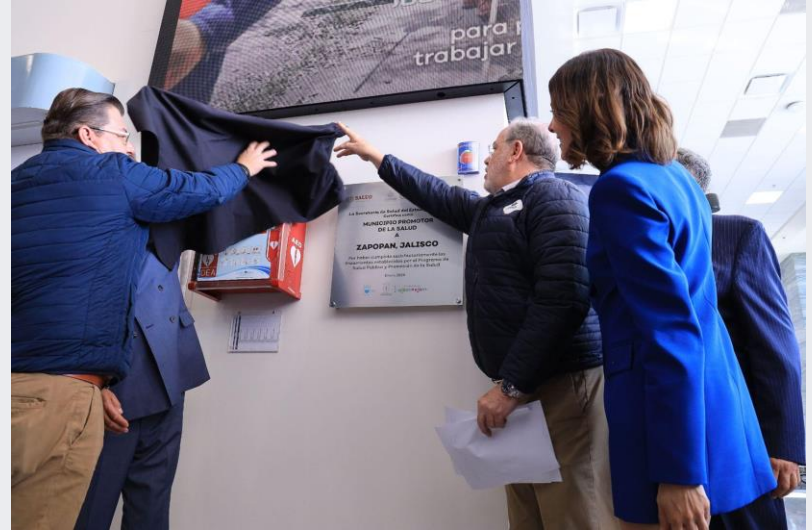
7 de febrero Certificación de Zapopan como Municipio Promotor de la Salud