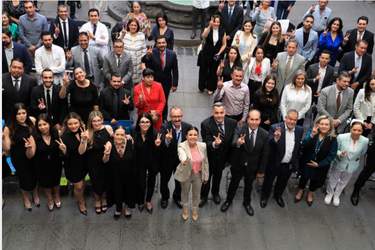
27 de febrero Graduación de residentes