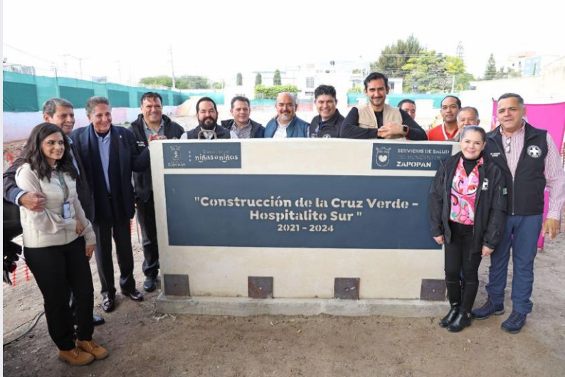
17 de enero Arranque de obra de Hospitalito Sur